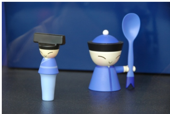
故宫文物创新造型

郭良文教授建议，深圳和香港的文化创意的发展不应一味求大，单纯以经济目的为导向。而要更注重传统文化的保护和发扬。对深圳这样一个移民城市，自身的资源禀赋有限的城市来说，可以考虑利用其他地方的资源，甚至利用全中国的资源。比如在台湾，台湾故宫博物院将古代的乾隆，古代的器具，如盐罐，胡椒罐等，邀请意大利的设计师，通过改造，将其