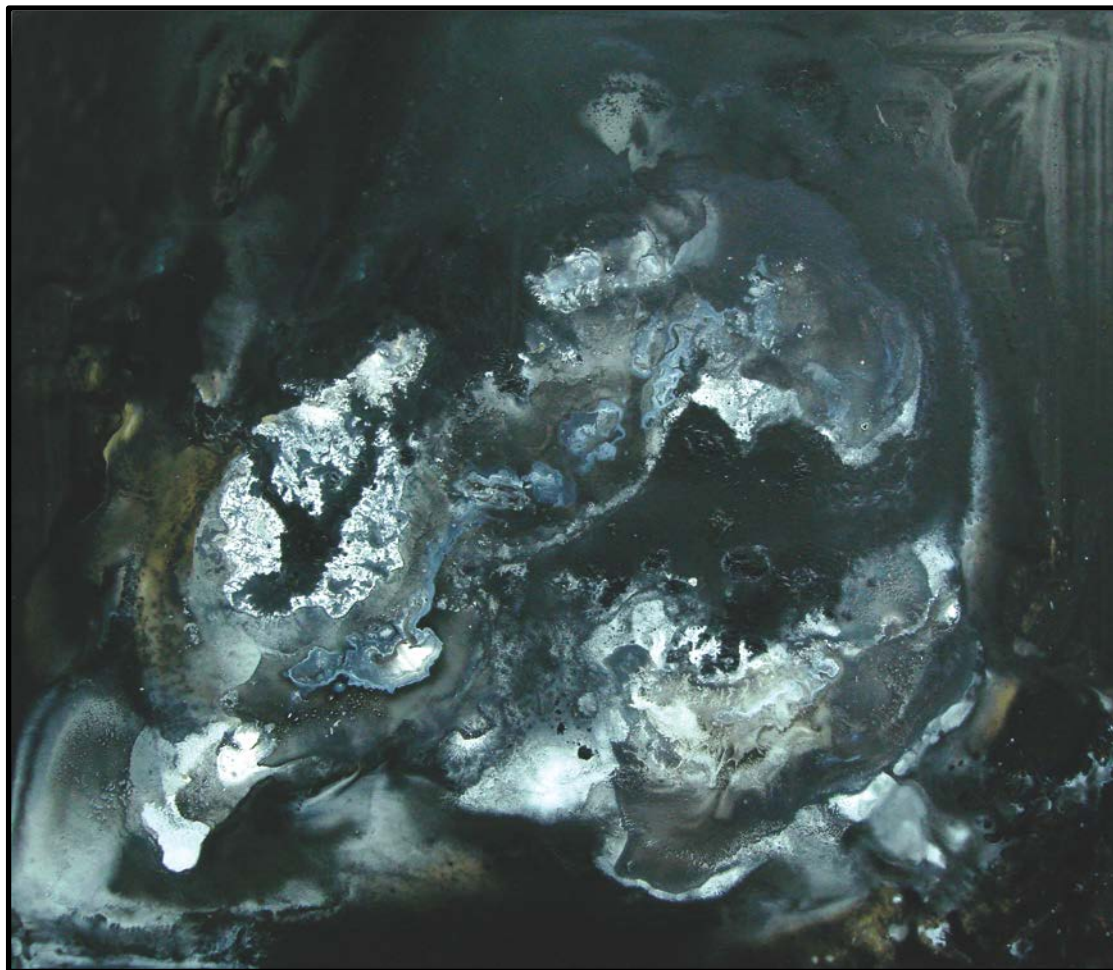
综合材料 46cm x 41cm 2011年

作者及作品：李丽红，深圳大学副教授。在《装饰》、《美术观察》、《美术研究》、《文艺研究》等国家级艺术类核心期刊上发表专业论文十数篇；编写高等院校艺术设计专业《素描》、《色彩》教材。作品曾被中国美术家协会、中央美术学院美术馆等美术馆以及国内外众多友人收藏。此《无题》图是作者近年新创作的作品，作者认为艺术是人的艺术，人是有局限的，这局限也会施加于艺术的各方面。在视觉艺术作品中，除了美还存在着更广泛的美学特性；除了人类总结归纳概括的美学特性，更存在着不言的大美。但是，在生活中，具有重要意义的艺术中的真可能比美更重要。（采编：罗春芳、张秋吉）