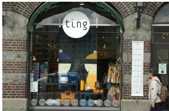
国际化营销 Burgen, Norway

2010年1月，台湾行政部门通过《文化创意产业发展法》，该法规其中有这样的规定：“政府为推动文化创意产业，应加强艺术创作及文化保存，文化与科技的结合，注重城乡均衡发展，并重视地方特色，提升国民文化，素养及促进文化艺术普及，以符合国际潮流”。此外前不久，台湾文化建设会成立文化部，将文化创意产业的业务变成它的管辖范围。